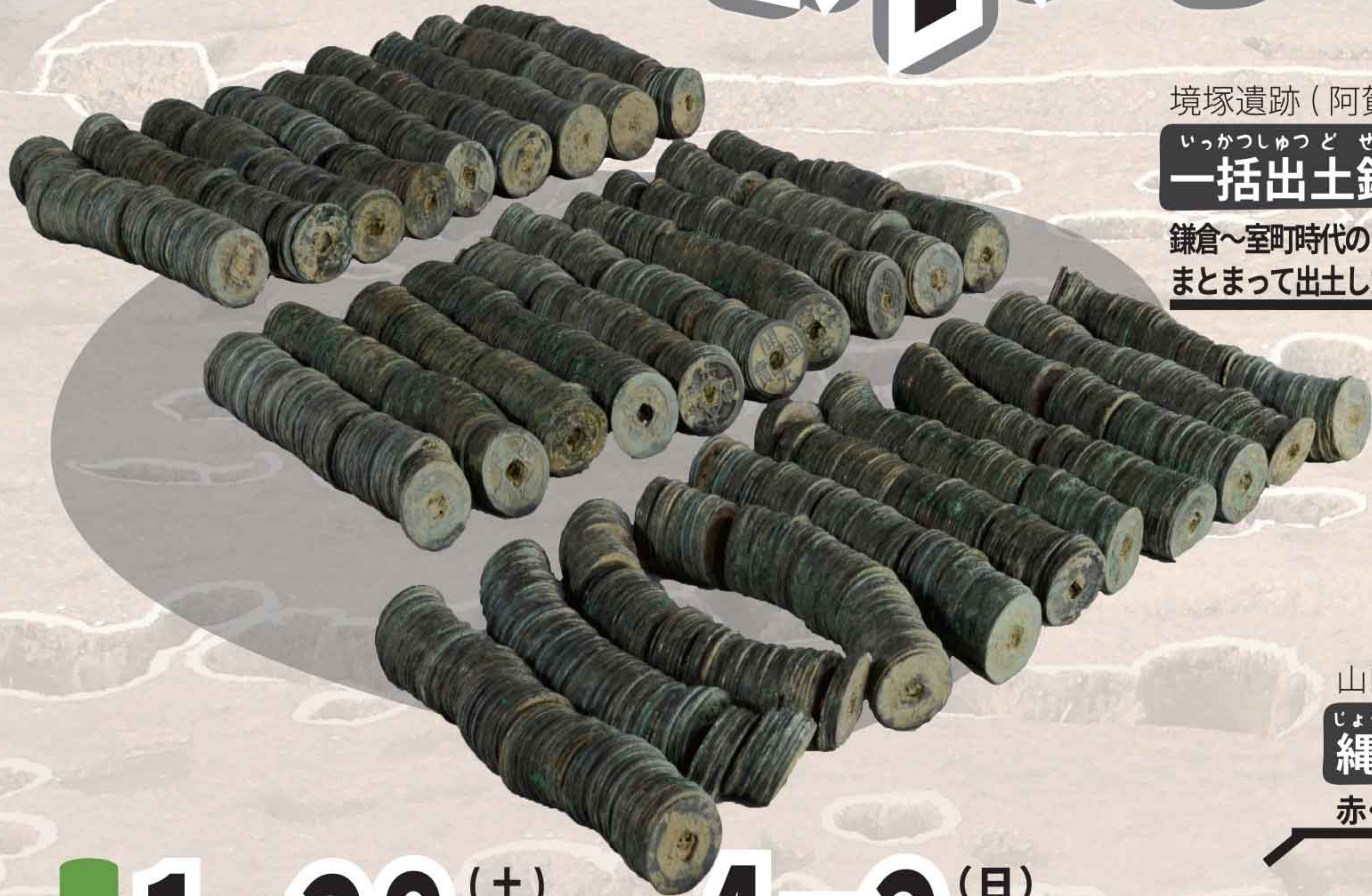
境塚遺跡(阿賀野市)