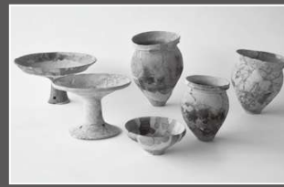
上越市裏山遺跡 弥生時代土器 [ 県指定 ]