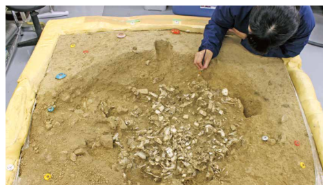
焼人骨集積土坑(村上市上野遺跡)

最新の発掘調査や整理作業の成果を出土品や写真で解説します。2026年度に発掘調査を行う村上市上野遺跡などを展示します。初公開の出土品多数!