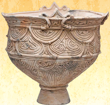
縄文土器 台付鉢(糸魚川市六反田南遺跡・県指定)