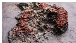
縄文時代の赤漆塗り糸玉 (新発田市青田遺跡・県指定)