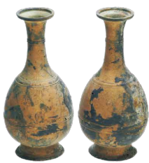
銅製花瓶 (長岡市大武遺跡)

新潟県埋蔵文化財調査事業団が発掘調査し、現在は市町村に譲与された出土品を中心に、新潟県の歴史を紐解くうえで重要な遺物を選別して展示します。各市町村を訪れないと観られない優品がめじろ押しです。