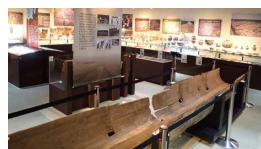
常設展示室と鎌倉時代の丸木舟 (阿賀野市石船戸末遺跡)

県内の旧石器時代から江戸時代の様子を概観できる通史展示のほか、縄文時代の赤漆塗り糸玉や鎌倉時代の大型丸木舟など当センター選りすぐりの収蔵品約500点をご覧ください。タブレット音声解説機やクイズコーナーもあり、歴史に親しんでいただける内容となっています。