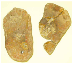
足型付土版(新潟市江南区西郷遺跡)