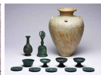
青銅製五鈴鉢ほかと古瀬戸四耳壺 (上越市木崎山遺跡・県指定)