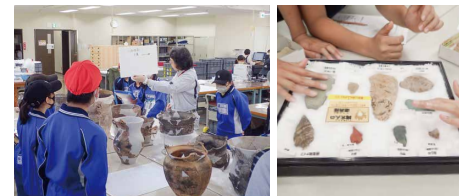
土器の復元作業などの見学

本物の縄文土器を用いた歴史学習や、火起こし・勾玉作りなどの体験学習、仕事見学ができる校外学習を受け入れています。また、当センター職員が学校に向く出前授業や、当センターならではの専門的な仕事ができる職場体験も行っています。ぜひご利用ください。