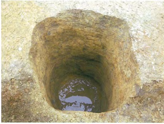
(井戸 SE9 南から)