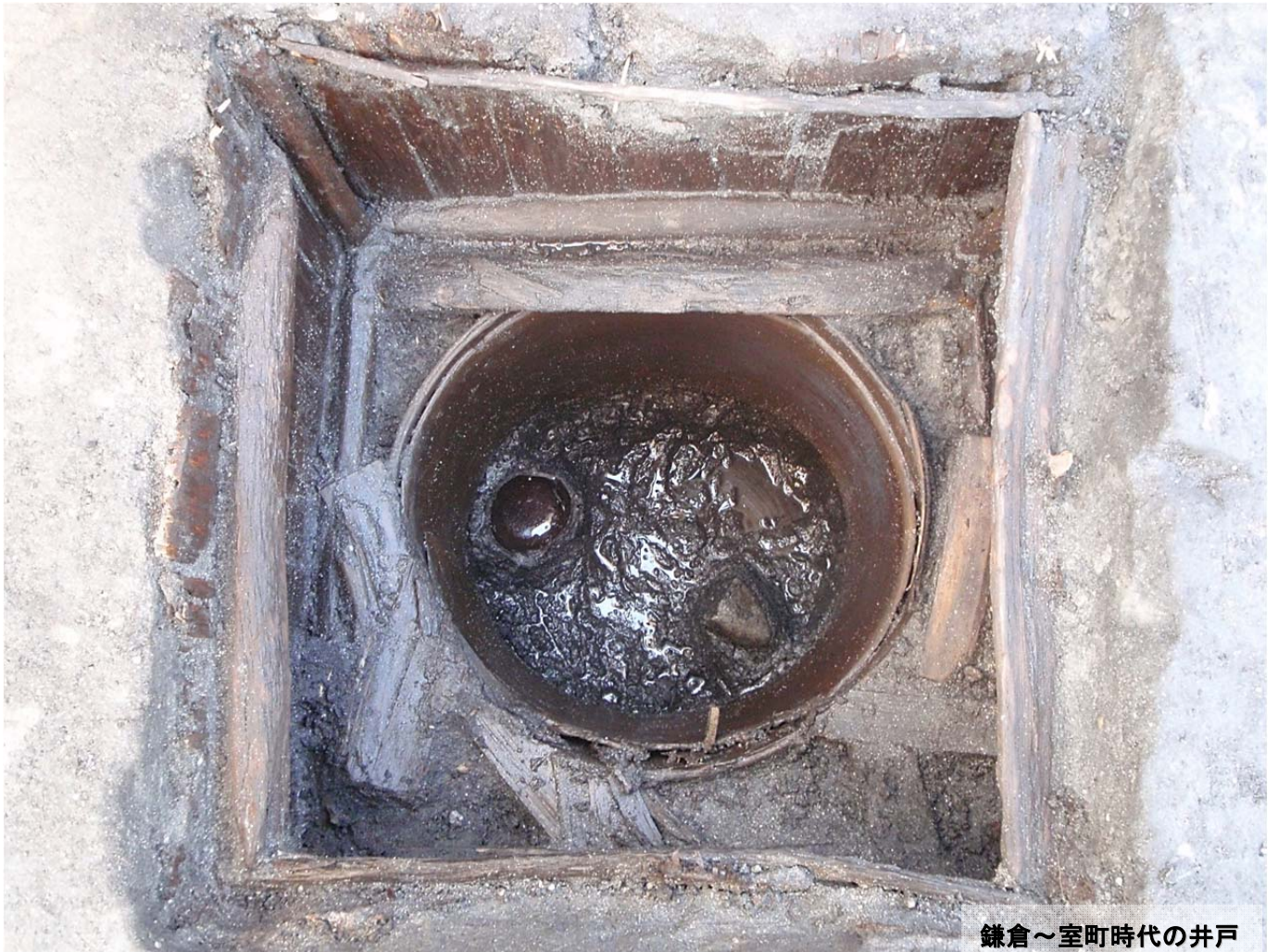
鎌倉～室町時代の井戸

日 時：平成 25 年 6 月 1 日（土） 10：00～12：00、13：30～15：00