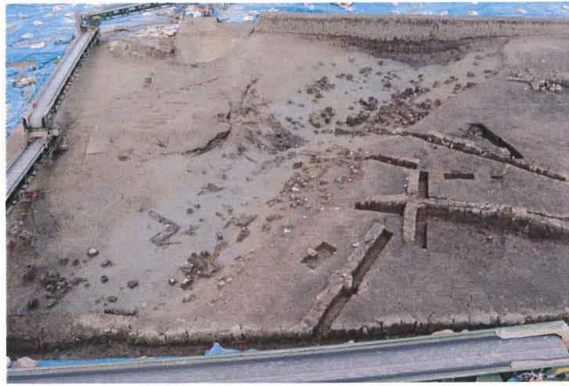
小河川 遺物出土状況