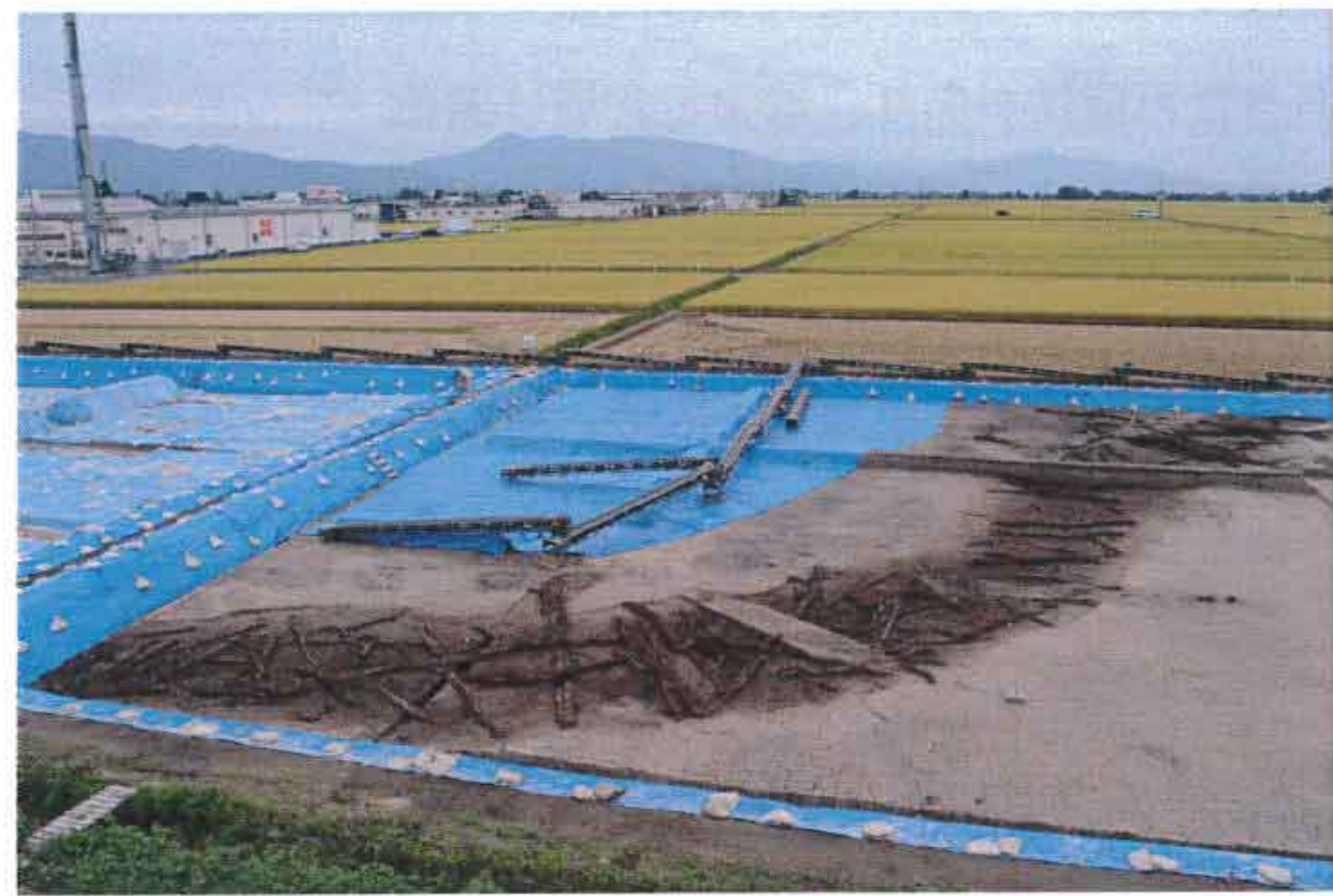
小河川 流木出土状況