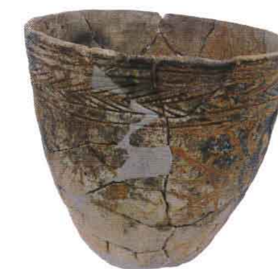
縄文時代晩期の土器