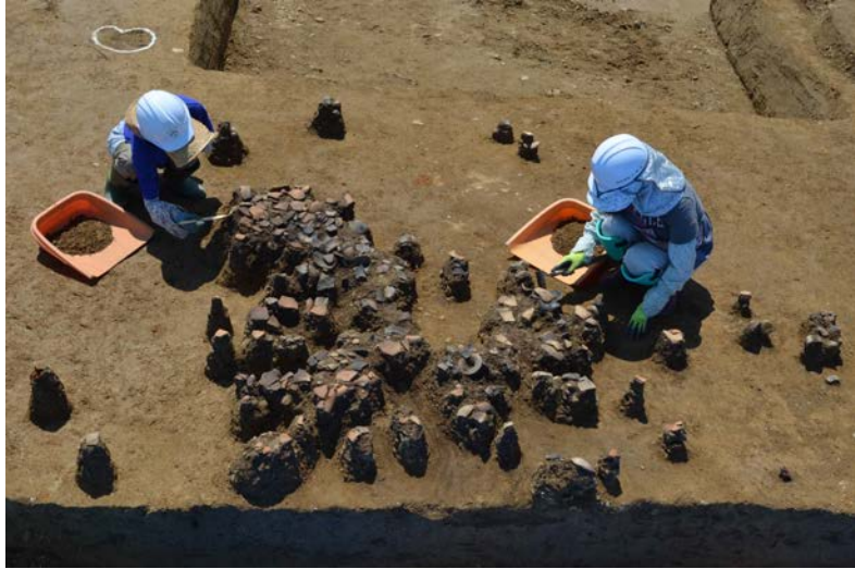
古墳時代の土器が出土した様子（六日町藤塚遺跡）