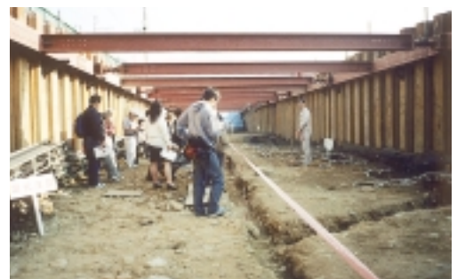
余川中道遺跡（六日町）