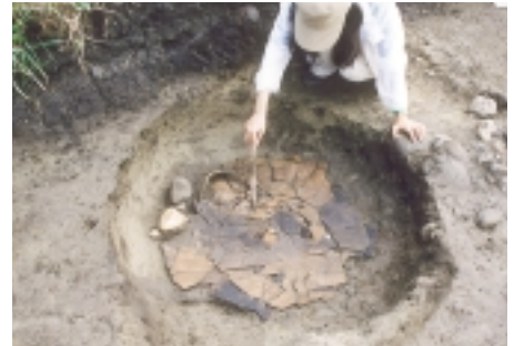
弥生時代再葬墓検出状況

分谷地 A 遺跡は、黒川村を流れる胎内川の左岸の段丘上（標高 100m）に位置しています。調査区は、ちょうど崖斜面を挟んだ上下段に分かれています。上段（平成 12 年度調査）では、8 基の弥生時代の再葬墓から 15 個体の壺や甕が出土しました。再葬墓とは、一度死者を骨にした後、再び骨壺である土器に埋納するという独特の葬法です。この遺跡で重要な点は、再葬墓としては、国内で最北端に位置すること、従来、この地域においては、複数の土器を一度に埋納する様相がみられるのに対し、一つの土壌に一つの土器が埋納されるという、縄文時代の埋甕の要素を極めて強く残すことです。また、現在の愛知県を中心に分布する水神平式土器の流れをもつものもみられるほか、ベンガラで赤く彩られたもの、人骨の可能性のある骨片が土器内部からみつかったものなどがありました。