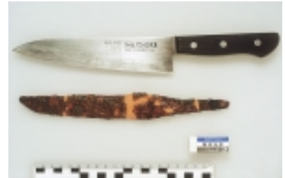
上：現代のステンレス洋包丁/ 下：刀子（宮野遺跡）

現在の包丁にあたる小刀は、平安時代より以前に中国から伝来したと推測されています。絵巻物には、小刀(刀子)を用いて果物の皮をむく姿や、俎板の上で刻む様子が見られます。さらに、鎌倉時代の文献からは鞘に入った日本刀で調理人が包丁さばきを披露する記載も見受けられます。このことから、刀から派生した包丁の系譜も考えられます。刀と包丁の機能分化は、鋼鉄の産出や鍛冶技術の発展に伴う中世から近世にかけてのことです。江戸時代に入ると、料理が発展して各種包丁が出揃ってきます。上越市の宮野遺跡からは平安時代の刀子が3点出土しています。当時この集落に住んでいた人々がこれを用いて調理をしていたのでしょうか。