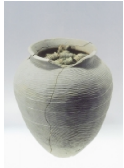
銭貨を取り出す前の珠洲焼壺