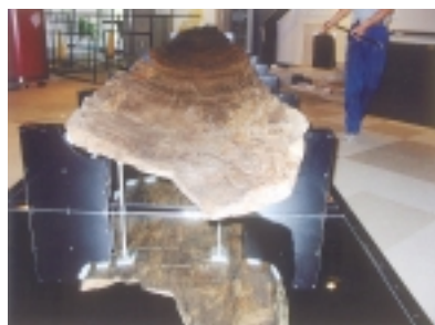
展示ケース取り付け前の様子