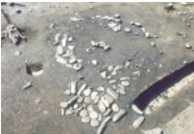
柄鏡形敷石住居（後期初頭）

遺物は縄文時代の土器・石器などを中心に膨大に出土しています。平成16年度末までの2か年の整理で縄文集落の様子が明らかにできるものと思います。（高橋保雄）