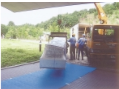
センターへ搬入された舟

前号で紹介しましたように、青田遺跡出土の丸木舟は 10 月末に展示を開始しました。全長約 5.4 m、幅 0.7 m の大きさは他のどの展示物よりも存在感があります。10 月 17 日に奈良県の元興寺文化財保存センターから運び込まれ、その後、展示ケースを取り付け公開しました。この丸木舟の特徴である平底をよく観察できるように展示台には鏡も取り付けられています。現在、土日の来館者は倍増しています。「大きいねえ」「よく残っていたなあ」など来館者の方々も興味・関心をもって見学されています。まだご覧になっていない方は、是非、お越し下さい。