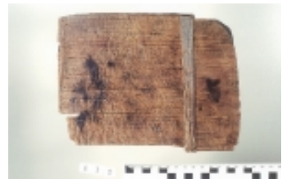
俎板（浦廻遺跡）裏面

本来、俎板というのはマナ(真魚)を調理する作業台のことで、魚介や鳥獣類を調理する際に用いていました。絵巻物には、まな箸という金属製の箸で獲物をおさえつつ包丁で切る姿が見られます。中世から近世にかけては、脚の付いた机のような形が主流でした。今日では板状となつて普及していますが、「1膳、2膳…」と数える訳がわかりますね。白根市浦廻遺跡(中世)からは多数の木製品が出土しています。その中に俎板として使用されたと見られるスギの板材が1点出土しています。板材の両面には無数の刃物傷が残っています。遺跡からは、同様の傷がついた曲物の底板なども出土することがあります。俎板などの工作台、作業台として転用したのでしょうか。