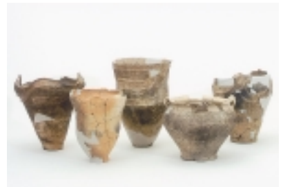
縄文土器（中期末葉～後期初頭）