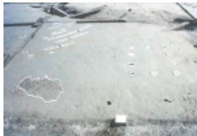
掘立柱建物の柱穴