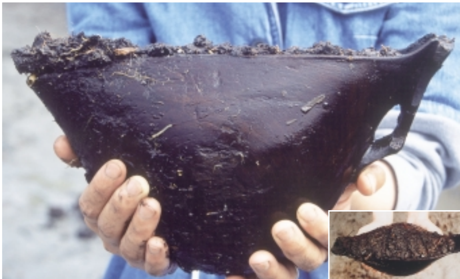
分谷地 A 遺跡出土の縄文時代漆製品

このように弥生時代の葬送儀礼を知る上で重要な 10 点の壺形土器や甕、そして縄文時代の木工や漆工芸の高い技術水準を示す木製の鉢や糸玉、朱塗り土製耳飾など 5 点が平成 15 年に新潟県の指定文化財となりました。 (黒川村教育委員会 伊藤崇)