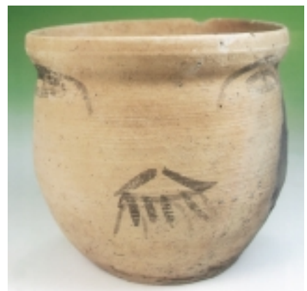
写真 人面墨書土器「船戸桜田遺跡2次」 中条町教育委員会