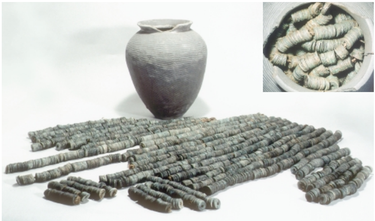
取り出した銭貨と珠洲焼の壺