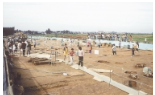
五反田遺跡（板倉町）

現地説明会の良さは検出された本物の遺構や出土した本物の遺物を現地で間近に見られることにあります。機会がありましたら是非、ご参加下さい。事業団では来年度も現地説明会の案内を日程が決まり次第、ホームページでお知らせします。